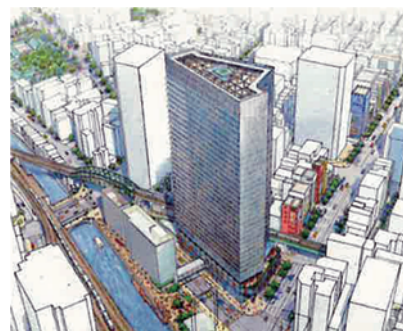
千代田区のホームページより

継続審議と思っていた。こんなに低い同意率なのに、外堀を埋めるような強引なやり方だった。