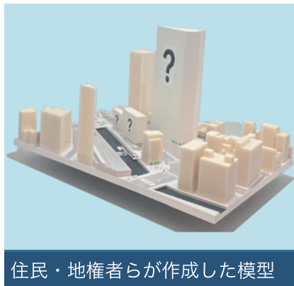
住民・地権者らが作成した模型