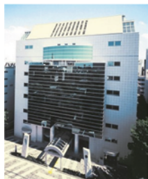
いきいきプラザ

「ザ番町ハウス」ができてから改善が進み、令和5年度の特別養護老人ホームの待機状況は 66人 。そのうち6割はすぐの入所希望ではないため、実質 26人程度 にお待ち頂いており、 半年ぐらいで入所 できる状況。