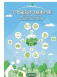
千代田区緑の基本計画 (区のホームページより)

『 街路樹健全育成マニュアル 』については、昨年度の調査を元に多様な専門家に助言を得て検討するとのこと。