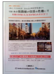
住民による「伐採反対」のポスター（上下共）

バリアフリーと自転車道のための道路工事であるが、本年3月の協議会では車いすの皆さんから、「夏の暑い日差しを遮る街路樹に感謝しながら移動している」との発言がありました。これまで私は、行政に「地域説明会をしてください」「住民に知らせてください」と言い続けましたが、実現することなく、工事着工となって、初めて伐採を知ったという住民の声が日々大きくなっています。酷暑の中の「暑さ」もバリアといわれるのに、本当のバリアフリーはどこにあるのでしょうか？