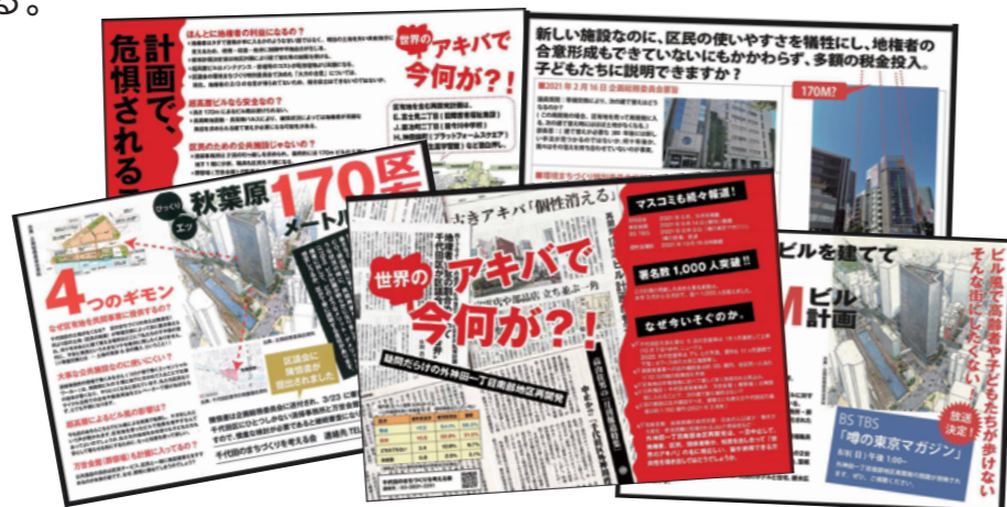
千代田のまちづくりを考える会 配布チラシより