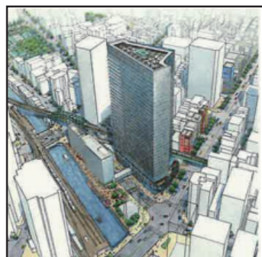
2020年10月30日企画総務委員会 外神田一丁目計画勉強会資料3より

強引な再開発と言えば、新聞や雑誌だけでなくテレビでも放映された外神田一丁目南部地区再開発。区内唯一の公共施設・清掃事務所・万世会館があるにもかかわらず、区民への説明会も地権者への説明会もされず、広報もしないまま、住民の意見も聞かず、再開発に同意している人数を水増ししたり、計画を押し通そうとしてきた。コロナ禍でのオリンピックも終わり、今後想定したような集客は見込めないにもかかわらず、区有地を等価交換し、ホテルを入れた再開発で、高さ170メートルもの超高層を建築しようとすることに、区民の不信の声が高まっている。