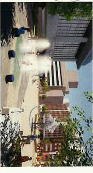
⑦ 公園東側石橋より西方向