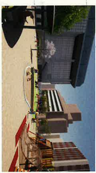
⑥ 公園北東石階段より南西方向