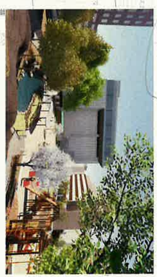
⑤ 錦華坂より南西方向