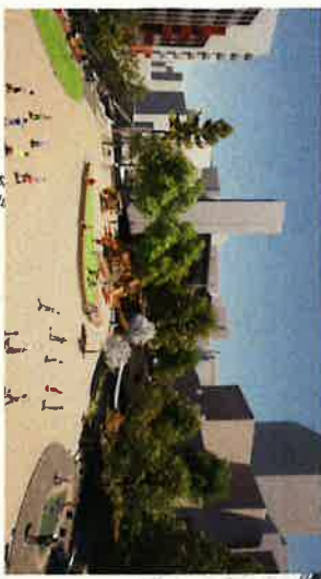
④ お茶の水小学校より北方向