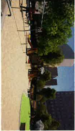
② 公園西側入り口より北東方向