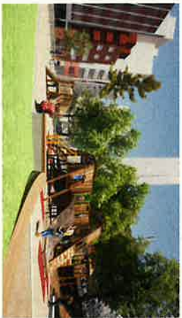
③ 公園中央より北方向