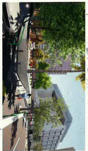
① 猿楽坂より南方向