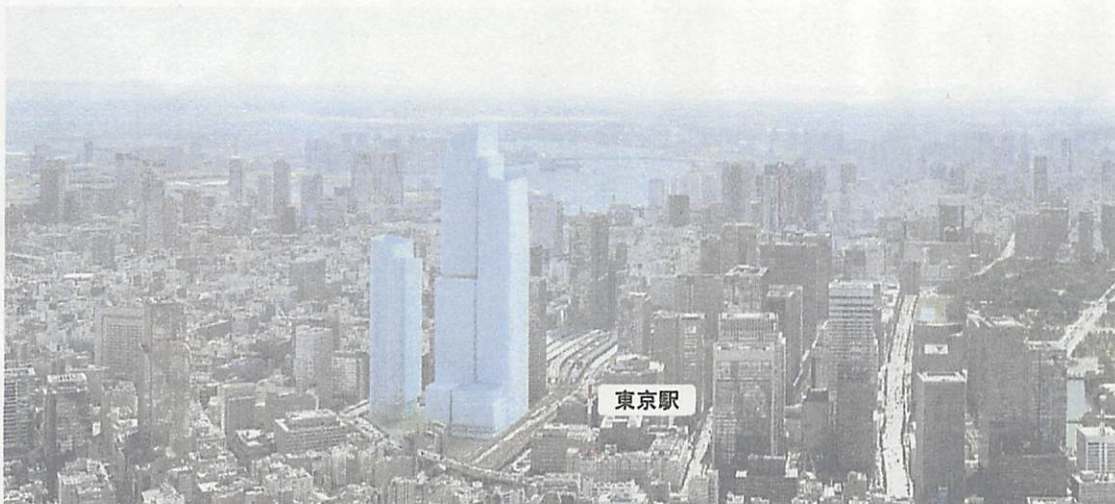
イメージパース（大手町北側上空より計画地方面を望む）