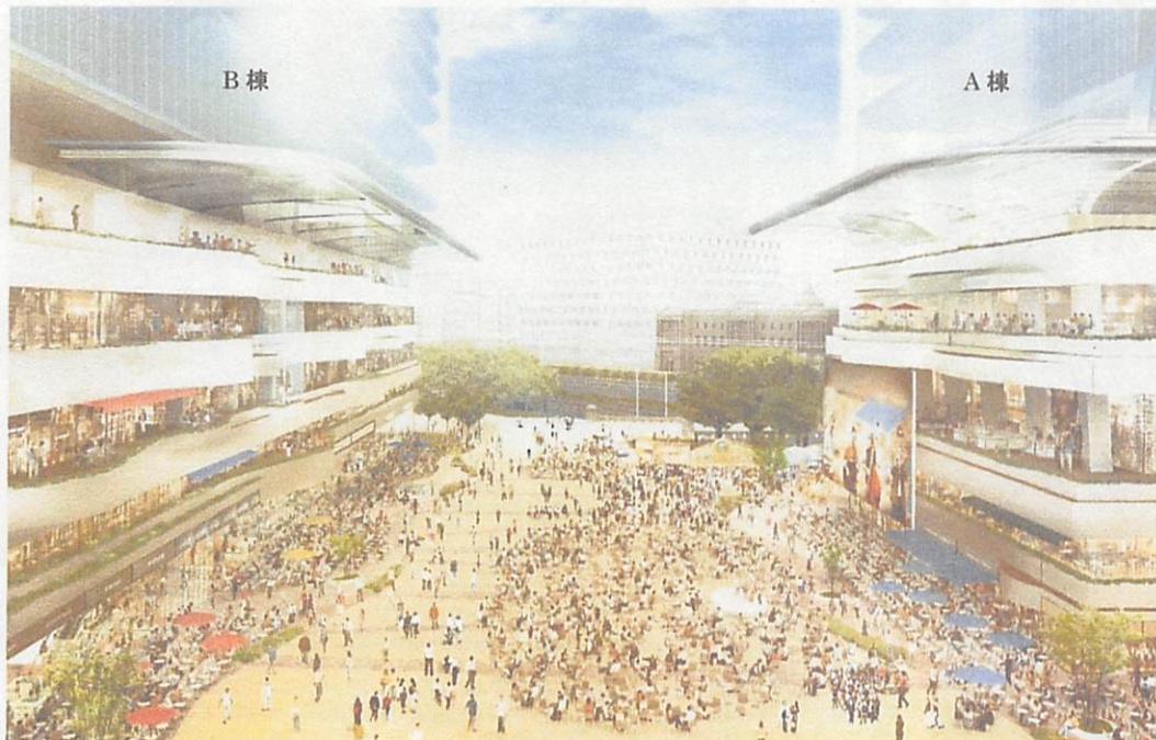
大規模広場イメージ（東京駅方面より）