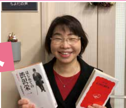
一會派控え室前で

〒102-8688 千代田区九段南1-2-1 千代田区役所7階 ちよだの声 TEL.03-3264-2111 (代表) FAX.03-3237-9805 メール. sumikokoeda@gmail.com 携帯. 090-5506-1516 〒101-0051千代田区神田神保町1-16 SKビル401号