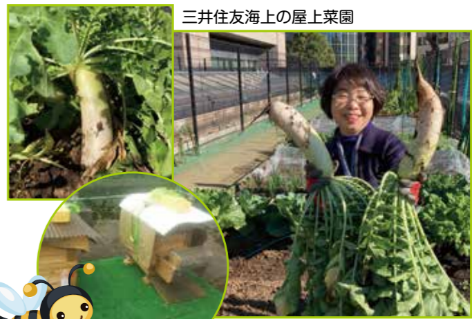
三井住友海上の屋上菜園

支え合いの千代田区、孤立のない千代田区、繋がり信頼できる千代田区を実現する切符はみなさんの手の中にあります!