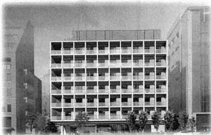
地上8階建, 鉄筋コンクリート(一部鉄骨)造