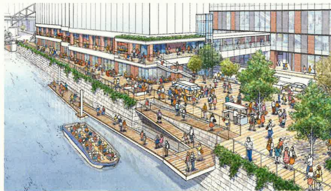
万世橋から親水広場をみたイメージ