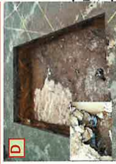
埋蔵文化財発掘調査 ピット7 大量の食器を確認 深さ確認不可