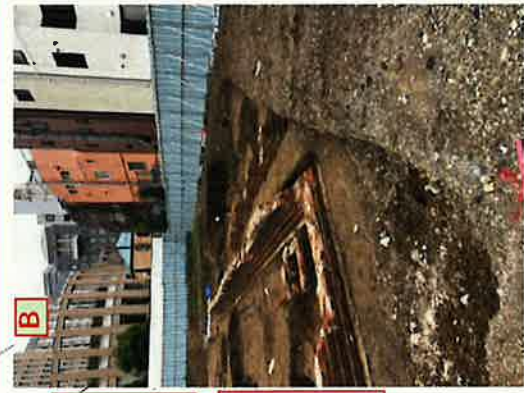
埋蔵文化財発掘調査 ピット6 R1.11月