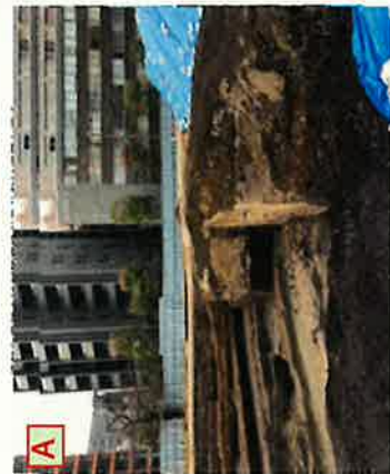
埋蔵文化財発掘調査中 R2.7月